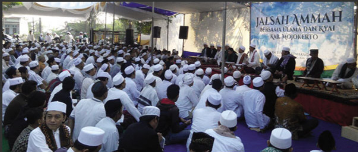
Mojokerto. Maraknya persekusi yang dialami sejumlah ulama, intelektual dan orang-orang yang menyuarakan kebenaran membuat sejumlah ulama Aswaja Jawa Timur bersikap. Dalam acara Jalsah Ammah Ulama dan Kiai Kabupaten Mojokerto, Jawa Timur Ahad [5/8] mereka membahas persoalan krusial ini. Puluhan Ulama Aswaja Jawa Timur hadir memberikan dukungan pada acara Jalsah Ammah yang digelar oleh Ulama dan Kiai Mojokerto ini.