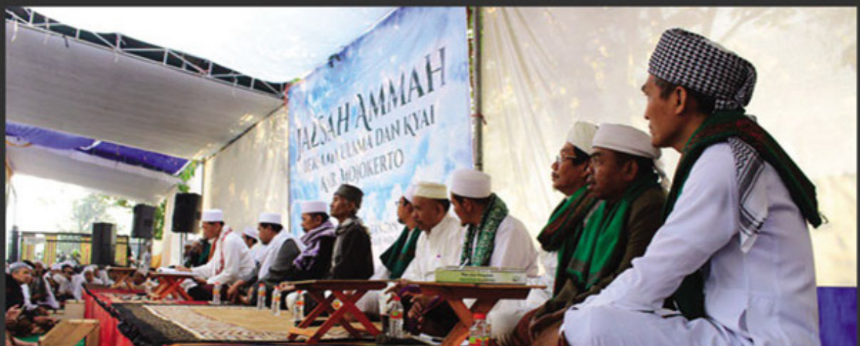
Mojokerto. Ulama dan Kiai Mojokerto pada Senin [20/8], menyerukan umat Islam merayakan Idul Adha bersama. Sebagaimana diketahui bersama, Mahkamah Ulya Arab Saudi mengumumkan bahwa hari Ahad (12/8) telah masuk bulan baru 1 Dzulhijjah 1439 H. Dengan penetapan ini, maka Hari Arafah tanggal 9 Dzulhijjah akan bertepatan dengan hari Senin (20/8) dan Hari Raya Idul Adha pada hari Selasa (21/8). Penetapan masuknya bulan baru tersebut, merupakan hasil pengamatan Tim Ru'yatul Hilal di beberapa tempat, seperti di As-Sudair dan As-Syaqra'.