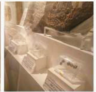
Mata uang dinar dan dirham (Byzantium, dll) yang dipakai zaman Rasulullah saw., Khalifah Abu Bakar dan Khalifah Umar.