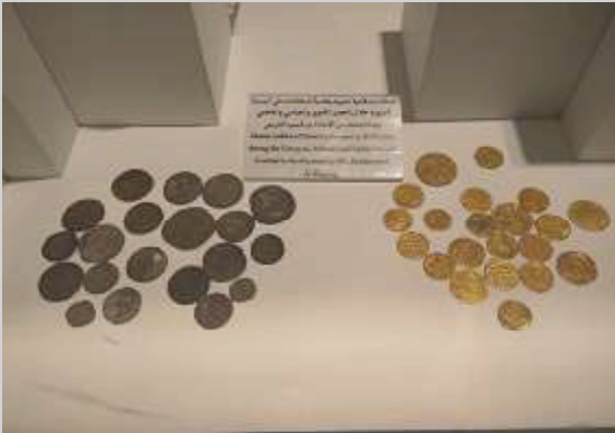
Uang Dinar dan Dirham masa Kekhilafahan Umayyah, Abasiyah dan Fatimiyah.