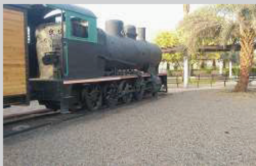
Lokomotif masih tersimpan rapi.

Al-Madina Museum Bangunan bekas Stasiun Kereta Api Hijaz, yang menghubungkan Turki hingga Madinah, kini menjadi Museum Sejarah Madinah.