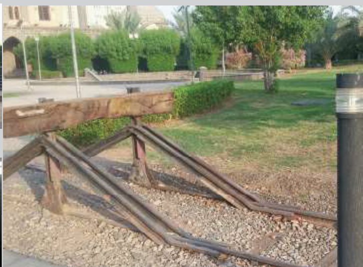
Ujung rel kereta api di dalam museum.