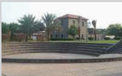
Taman di dalam museum.