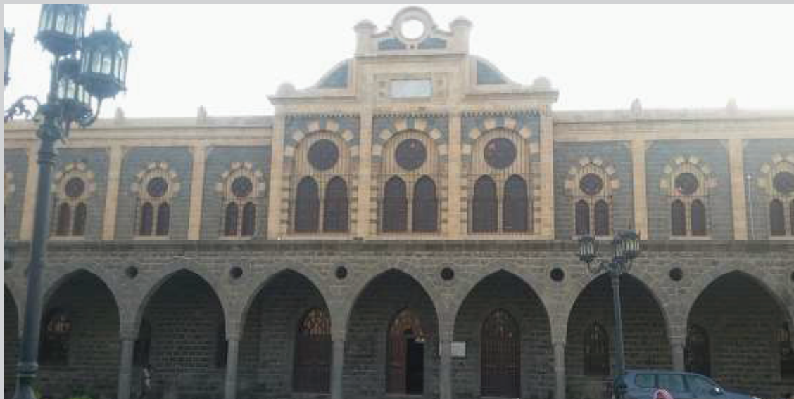
Gedung Museum Al-Anbariya.

Al-Madina Museum Bangunan bekas Stasiun Kereta Api Hijaz, yang menghubungkan Turki hingga Madinah, kini menjadi Museum Sejarah Madinah.