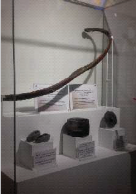
Busur panah milik sahabat Saad bin Abi Waqas masih tersimpan rapi.