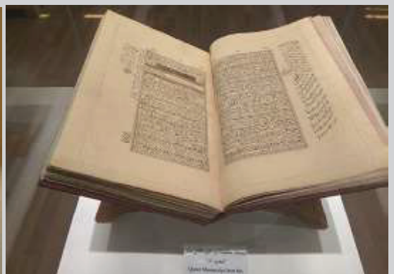
Manuskrip al-Quran pada Abad 12.