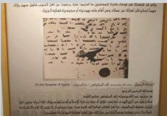
Copy surat Rasulullah saw. kepada Gubernur Mesir.