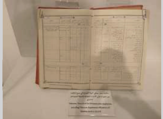
Buku pencatatan pegawai Khilafah Turki di Madinah.