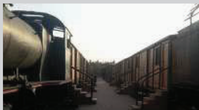
Gerbong makan dan penumpang.