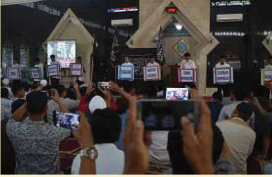
Makassar. Menyambut Tahun Baru Islam 1 Muharram 1441 H, LDKS Kaffah menyelenggarakan Tabligh Akbar dengan Tema, "Hijrah Menuju Syariah Kaffah, Sabtu (31/8).