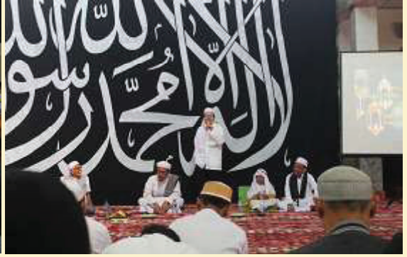
BANJARMASIN. Tabligh Akbar menyambut 1441 H digelar Forum Silaturahmi Majelis Taklim (FSMT) Banjarmasin, di Masjid Besar At-Taqwa, Jalan Jendral Ahmad Yani Kilometer 4,5, Sabtu [31/8].