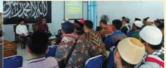
Dompu. Acara Tabligh Akbar Kabupaten Dompu Memperingati Tahun Baru Islam 1441 H pada hari Sabtu [31/8] bertempat di Gedung Darma Wanita Kabupaten Dompu, NTB, yang mengangkat tema "Hijrah Menuju Syariat Kaffah".