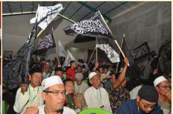
Lamongan. Gelegar menyambut Tahun Baru Hijriyah pada Sabtu [31/8] terasa juga di Lamongan. Berduyun-duyun umat Islam di sekitar wilayah Lamongan menghadiri Tabligh Akbar 1 Muharram 1441 H. Momentum tabligh akbar ini menandai kerinduan umat Islam seluruh dunia dalam meneladani sirah Rasulullah saw.