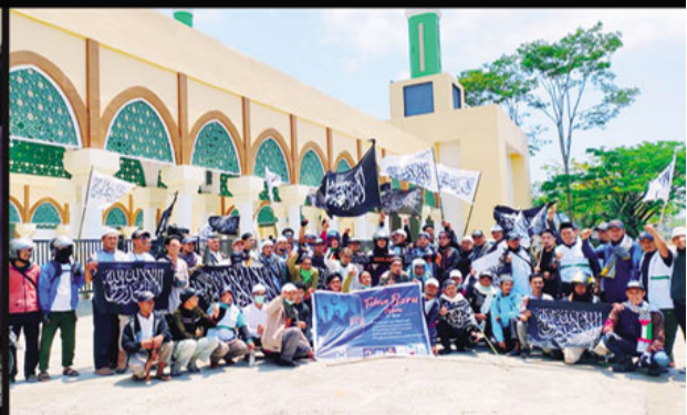
Morowali. Semarak Pawai Muharam 1441 Hijrah berupa Parade Tauhid daerah Morowali Provinsi Sulawesi Tengah diadakan oleh Majelis Cinta dan komunitas-komunitas lainnya pada hari Ahad [1/9].