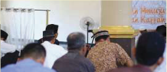
Majene. Semarak Tabligh Akbar Muharram 1441H digelar di Masjid Nurul Taufiq Kec. Malunda Kab. Majene dengan mengusung tema "Hijrah Menuju Syariat Kaffah" pada Sabtu pagi oleh Aliansi Umat Islam Bersatu, sabtu [31/8].