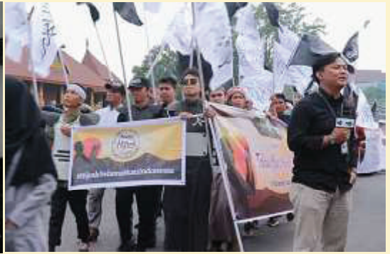
Pontianak. Ribuan umat Islam di Kota Pontianak berkumpul menyambut pergantian Tahun Baru 1441 H di depan Kantor Walikota Pontianak. Pawai ta'aruf ini merupakan agenda tahunan yang diselenggarakan oleh Panitia Hari Besar Islam (PHBI) Kota Pontianak.