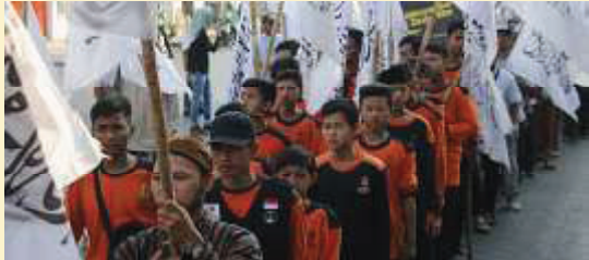
Semarang. Ahad [1/9], Ormas dan komunitas Kota Semarang mengadakan Parade Ukuwah Muharam 1441 H yang dihadiri ratusan orang. Terlihat massa dari Forum Umat Islam Semarang (FUIS), Forum Silaturahmi Umat Islam (FSUI), Jamaah Ansyarru Syariah (MM), Hidayatullah, Masyarakat Tanpa Riba Kota Semarang, BARSAMA, LBH Pelita Umat Semarang dan masih banyak organisasi dan komunitas yang ikut hadir