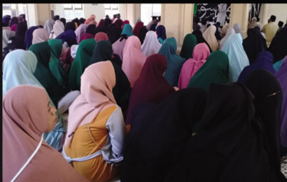
Takalar. Kegiatan Muharam 1441 H di Kota/Kab. Takalar dihadiri oleh sekitar 250 peserta