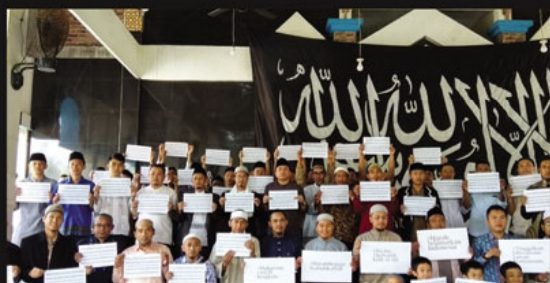
Bengkulu. Tahun baru Muharam 1441 Hijrah merupakan tahun umat Islam yang bersejarah karena diperingati oleh ratusan peserta dari semua elemen masyarakat Kota Bengkulu di Masjid Albaar, Kota Bengkulu pada Sabtu (31/8). Panitia acara memberi tema Tabligh Akbar ini dengan "Hijrah Menuju Islam Kaffah".