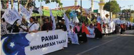
Mataram. Ahad [1/9] Komunitas Cinta Negeri melaksanakan kegiatan Pawai Muharram di Kota Mataram yang diikuti oleh ratusan peserta.