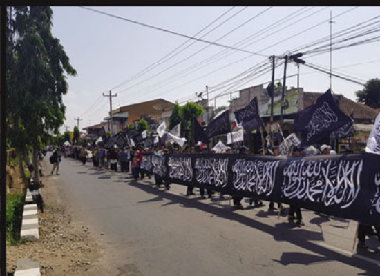
Cilacap. Dalam rangka menyambut tahun baru 1441 Hijriyah, Hari Ahad [1/9], umat Islam Cilacap raya tumpah-ruah di alun-alun Kota Cilacap mengikuti acara Pawai Muharam yang digagas oleh Aliansi Alumni 212 (AL-AZIZ) Peserta pawai Muharam melakukan longmarch dengan start alun-alun kota Cilacap menyusuri Jl. Jendral Sudirman, dilanjutkan ke Jl. Tendean, Jl. RE Martadinata, dan Jl. A. Yani kembali ke alun-alun.