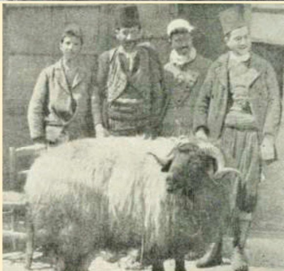
A BAI RAM : CANEA.