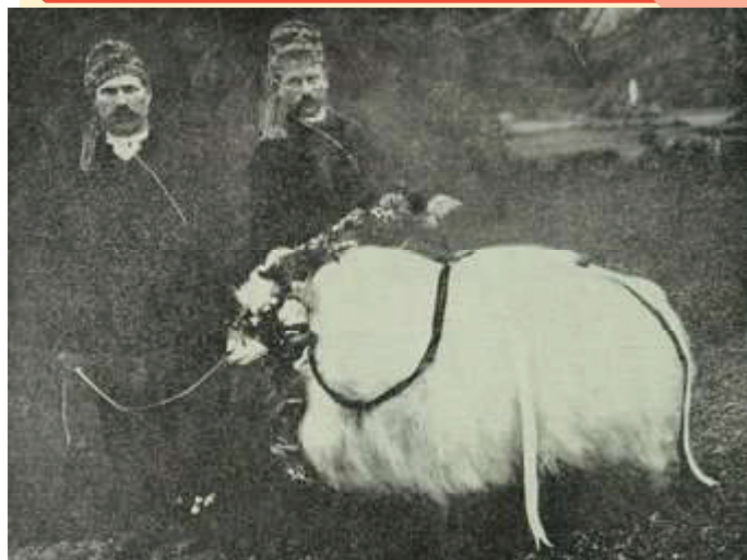
Persembahan hewan kurban terbaik.