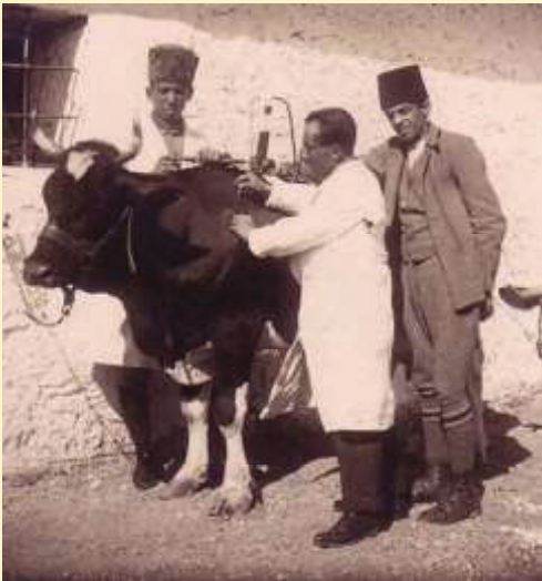
Hewan kurban diperiksa oleh dokter hewan sebelum disembelih.