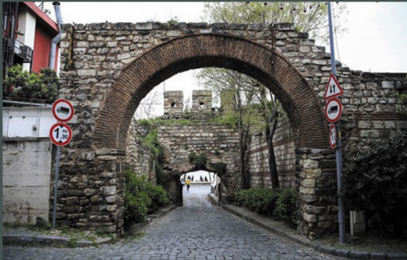
Gerbang Barry. Terletak di Distrik Ahirkap yang bersejarah di Sarayburnu Istanbul.