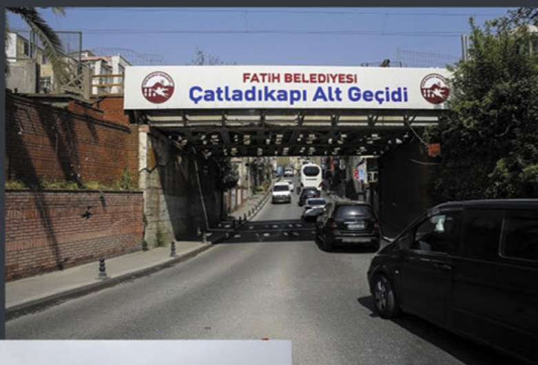
Penampakan Gerbang Cilabikapi.

Gerbang Retak atau Atdıkapı adalah gerbang yang berada di Distrik Fatih di sisi Eropa Istanbul. Namanya disematkan setelah pembentukan retakan besar di dinding selama gempa Istanbul 1532.