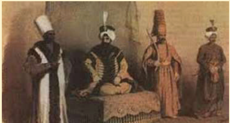
Khalifah dan seluruh aparat menyambut Idul Adha dengan penuh sukacita.