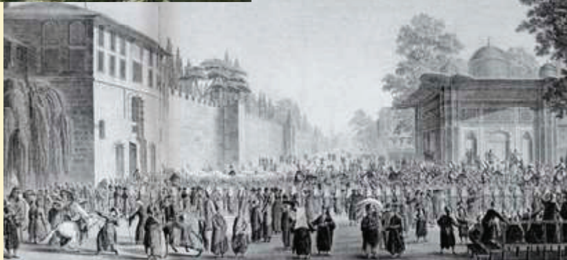
Suasana Idu Adha yang begitu gembira.