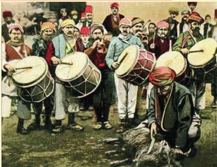
Takbir dan iringan musik penuh semangat mengiringi proses pemotongan hewan kurban.