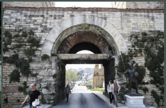
Gerbang Belgrad. Belgradkapi terletak di antara Distrik Zeytinburnu dan Fatih di sisi Eropa Istanbul.