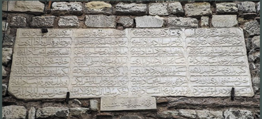
Distrik itu dinamai Ahirkap karena kendang kuda Istana Topkapi dulu ada di sini.