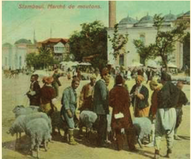
Pedagang dan pembeli bertemu.