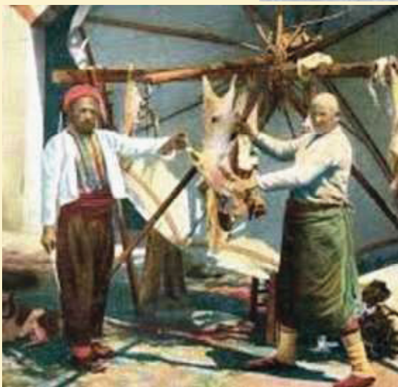
Hewan kurban siap di kuliti dan dipotong-potong.