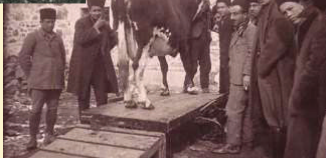
Persembahan hewan kurban terbaik.