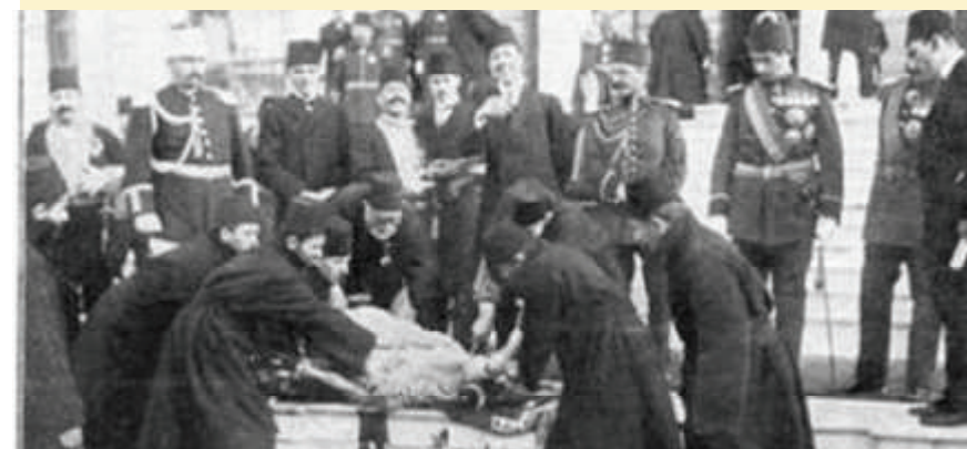
Pelaksanaan pemotongan hewan kurban yang langsung diawasi oleh Negara.