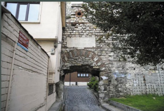
Sisi lain Gerbang Barry.