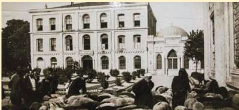
Hewan kurban yang begitu banyak siap didistribusikan kepada yang berhak.