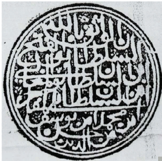
Cap-cap resmi Kesultanan Banten. (Kiri) Cap Sultan Abu'l-Fath 'Abdul Fattah, alias Ageung II ing Tirtayasa;

atas. Terlihat hanya dirinya, ayahnya (Sultan Abu'l-Ma'ali) dan kakeknya (Sultan Abu'l-Mafakhir) yang menggunakan gelar "Sultan". Adapun buyut-buyutnya (Muhammad, Yusuf, Hasanuddin) yang merupakan tiga penguasa awal Banten hanya disebut nama tanpa ada gelar "Sultan". Pada titik ini kita perlu menyorotkan pandangan secara khusus kepada sosok Sultan Abu'l-Mafakhir (berkuasa 1624-1651). Sebabnya, bermula dari posisinya dirinyalah gelar "Sultan" dalam urutan raja-raja Banten pertama kali dipakai, sebagaimana yang tertera dalam cap cucunya.